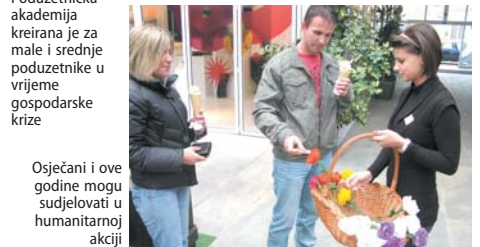
Osječani i ove godine mogu sudjelovati u humanitarnoj akciji