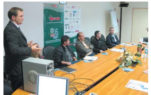
Poduzetnička akademija kreirana je za male i srednje poduzetnike u vrijeme gospodarske krize