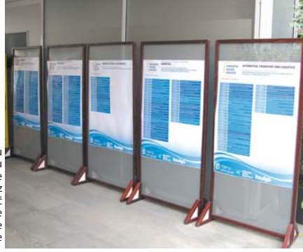
Pronači novu poduzetničku ideju je najlakše uz pomoć Europske poduzetničke mreže