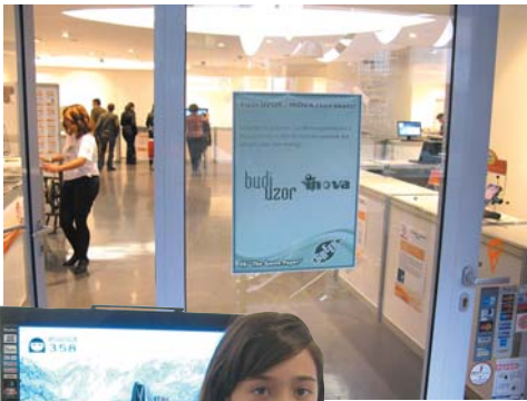
BUDI UZOR®/INOVA® čuva okoliš posebnom brigom oko izrade postera