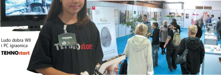
Ludo dobra Wii i PC igraonica TEHNOstart