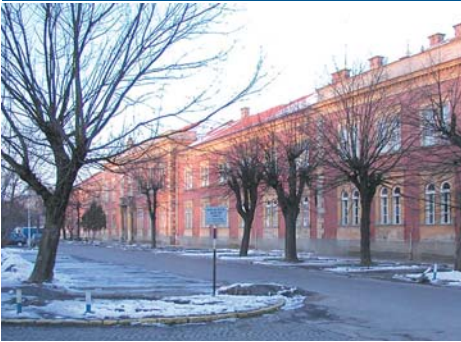
Tehnologijsko-razvojni centar u Osijeku d.o.o.