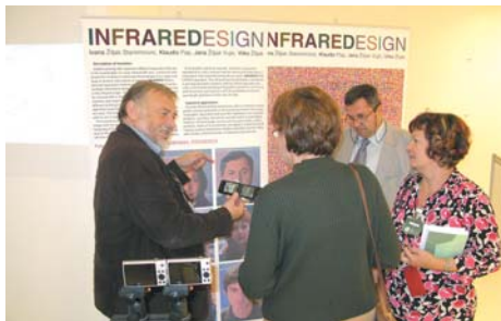
Dobar primjer inovacije koja dolazi sa sveučilišta