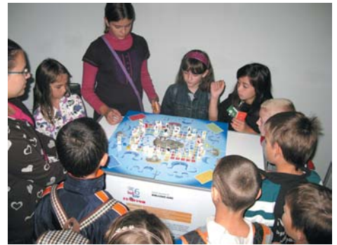
Biblijske igre izazvale su veliki odziv najmanjih