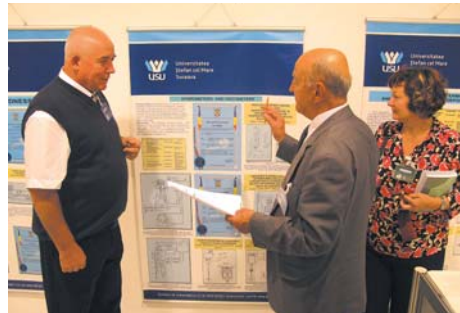
Izlagачi iz Rumunjske