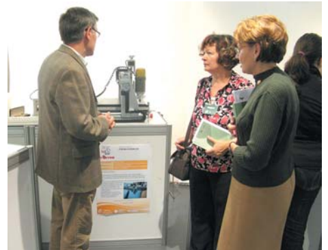
Povjerenstvo za ocjenu inovacija danas ima pune ruke posla