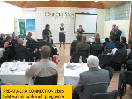
PRE-MU-DRA CONNECTION skup bilateralnih poslovnih pregovora na kojima su stanari inkubatora Tera ostvarili niz perspektivnih poslovnih kontakata