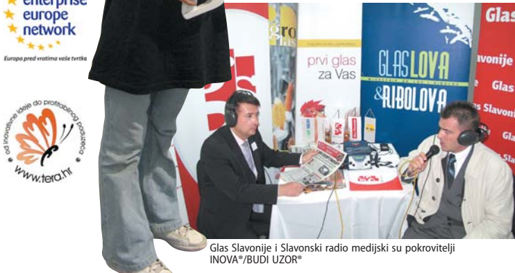
Glas Slavonije i Slavonki radio medijski su pokrovitelji INOVA®/BUDI UZOR®