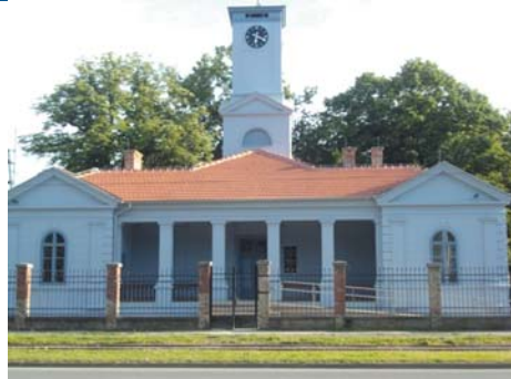
Ured za transfer tehnologije