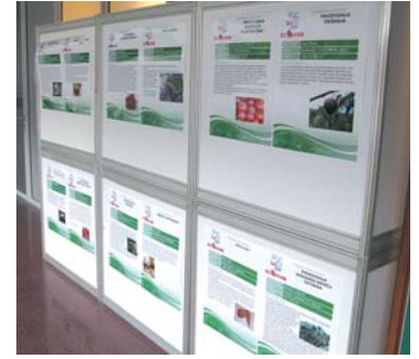
Važan dio izložbe su studentski poslovni planovi