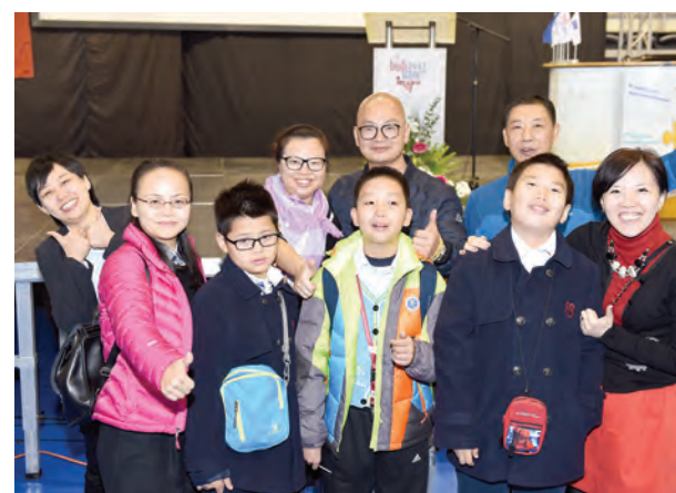
● Na izložbi su sudjelovali i mladi izlagači i inovatori.